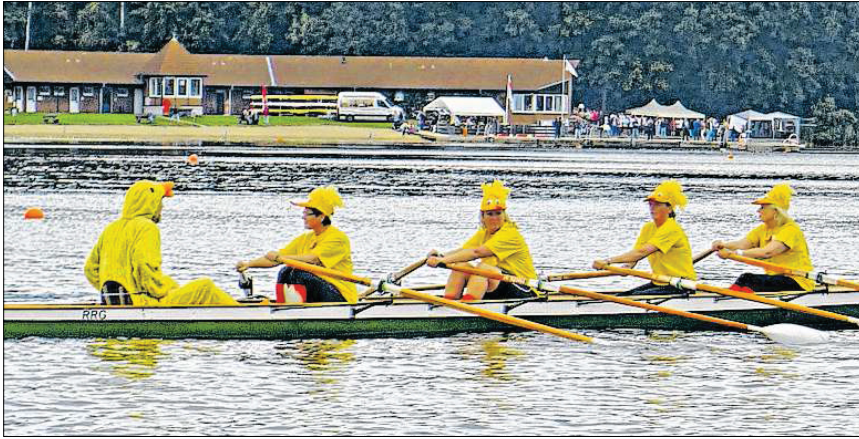
Am Wettkampftag geht es um die besten Zeiten, aber auch um die schönste Kostümierung.