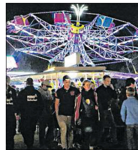
Der Karpfenplatz mit dem Twister wird vor allem von Jugendlichen angesteuert.

10 Uhr: Gottesdienst unter freiem Himmel mit dem Posaunenchor 11.15 Uhr: BigBand der Freiwilligen Feuerwehr Reinfeld und der Spielmannszug der Freiwilligen Feuerwehr Neubukow 13.30 Uhr: Kindertanzen Preußen Reinfeld -