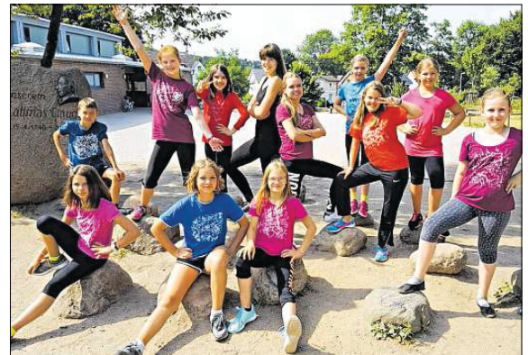
Auch bei „Dancing Motion“ steht der Spaß an der Bewegung im Vordergrund.

Was bieten Sportvereine eigentlich alles an? Fußball, Handball und vielleicht auch noch Leichtathletik? Pustekuchen: Der SV Preußen Reinfeld hat unter anderem mit „Dancing Motion“, „Dance Kids“, den „Tanzmäusen“ und „Rhythm Attack“ wesentlich mehr zu bieten. Was genau darunter zu verstehen ist und was die Kinder und Jugendlichen inzwischen alles können, davon sollte sich jeder selbst ein Bild machen. Am Karpfenfest-Sonntag gehört der Platz vor und auf der Karpfenbühne von 13.30 bis 14.30 Uhr ausschließlich dem Tanz-Nachwuchs des SV Preußen Reinfeld.