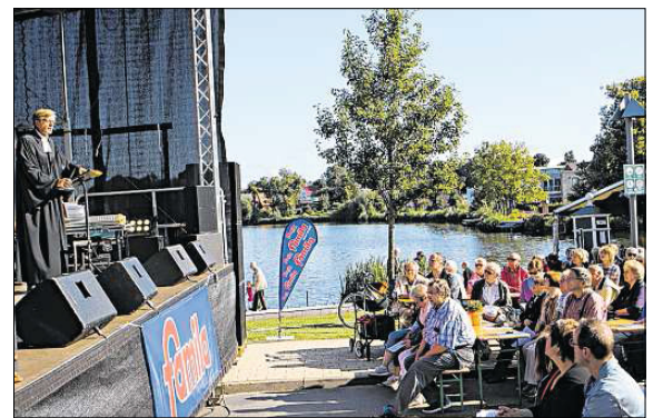
Immer gut besucht: Der Open-Air-Gottesdienst.

Vor dem Gottesdienst, der um 10 Uhr beginnt, ist für die vielen fleißigen Helfer des Karpfenfestes Stühleschleppen angesagt - und das nicht zu knapp. „Im vergangenen Jahr hatten wir sämtliche Bänke aus dem gesamten Festgebiet aufgestellt und auch die Stühle aus dem Gourmetzelt haben wir für die Gottesdienstbesucher bereitgestellt. Das