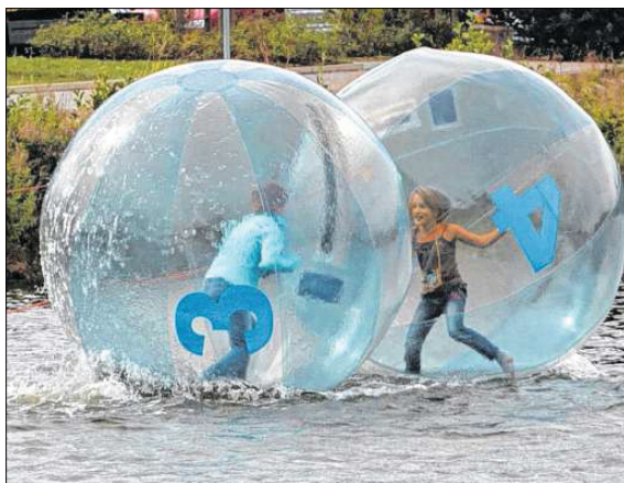
Sieht einfach aus, ist es aber nicht. Um mit den Walking-Balls über das Wasser zu gehen, braucht es viel Konzentration und Geschicklichkeit.

Die durchsichtigen Bälle mit einem Durchmesser von mehr als zwei Metern sind mit zugezogenem Reißverschluss absolut wasserdicht. Was auf den ersten Blick einfach aussieht, ist allerdings eine schweißtreibende Angelegenheit, die nicht nur Kondition, sondern auch eine große Portion Balance, Konzentration und Geschicklichkeit voraussetzt.