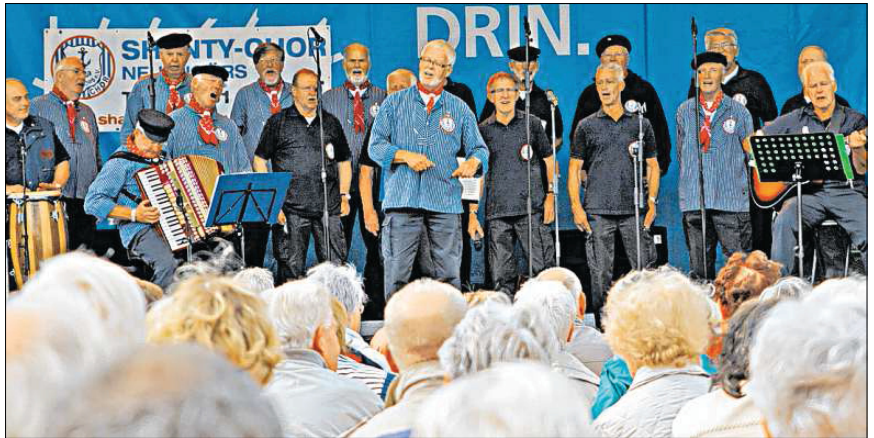
Beliebtes Highlight beim Karpfenfest: Der Shantychor Neuengörß.

Die 1983 gegründete Formation mit ihren 35 Sängern ist nicht nur stimmungsvoll, sondern hat auch ein schier unerschöpfliches Repertoire, mit dem die Seebären in ihren gestreiften Fischerhemden nicht nur in den Kreisen Stormarn und Segeberg unterwegs sind. Nicht nur auf lokalen