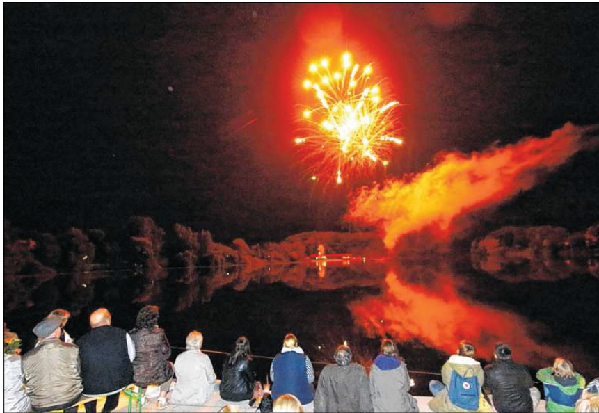
Das Höhenfeuerwerk taucht den Herrenteich in bunte Farben.