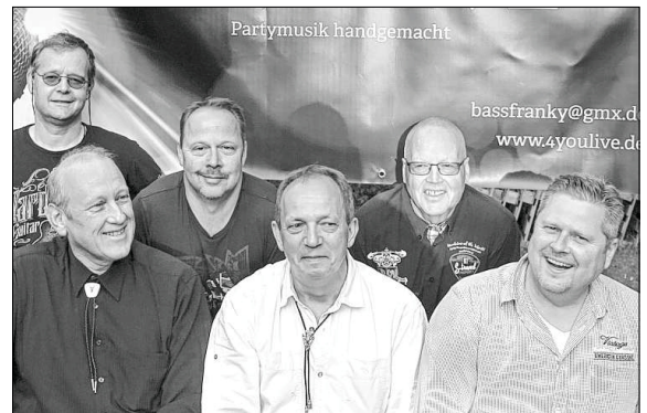
Bieten Party-Musik vom Feinsten: 4YouLive.

4YouLive, Freitag, 31. August, Karpfenbühne, 19 Uhr.