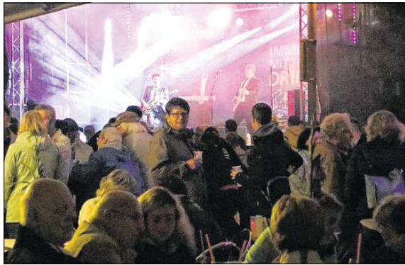
Auf zwei Bühnen wird den Besuchern des Karpfenfestes abwechslungsreiche Livemusik geboten.