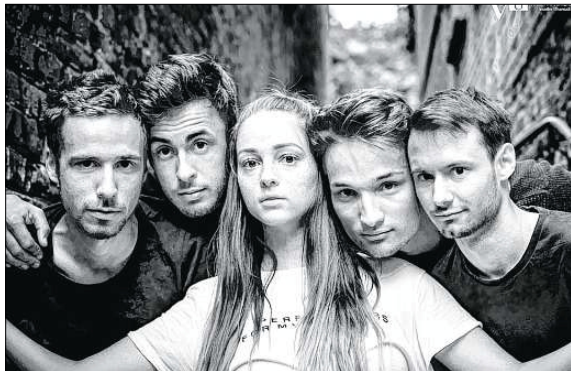
Die Gruppe „Days of Northern Lights“ spielt bereits zum dritten Mal auf der Karpfenbühne.

„Shantychor Neuengörß“: Sonntag, 2. September, Karpfenbühne, 17.30 Uhr