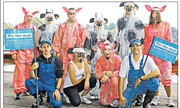
Gleich zwei gemischte Mannschaften mit Schweinen und Kühen stellte die Firma Duräumat. Foto: pd

Teil selbst ausgedacht und in Handarbeit gefertigt sind. Die Phantasie der teilnehmenden Mannschaft ist nahezu grenzenlos und so sind schon rudernde Wikinger, eine ganze Mannschaft voller Holzwürmer, Bauarbeiter und sogar Presseenten an den Start gegangen. Die auf Stallrichtungen spezialisierte Reinfelder Firma Duräumat schickte in einem Jahr zwei Teams ins Rennen, die sich entsprechend ihres Arbeitsbereiches gekleidet hatten: Die einen hatten ihre Overalls auf Schwein getrimmt, die anderen waren unzweifelhaft als Kühe zu erkennen. pd