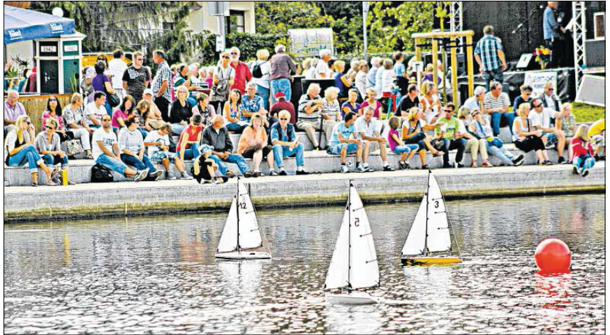
Acht Boote kämpfen am Sonntag bei der Modellboot-Regatta um den Sieg.