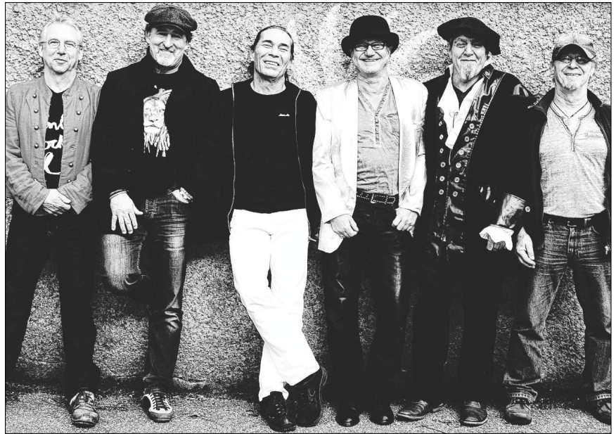
Spielen am Freitag vor und nach dem Feuerwerk: „The Solution“.