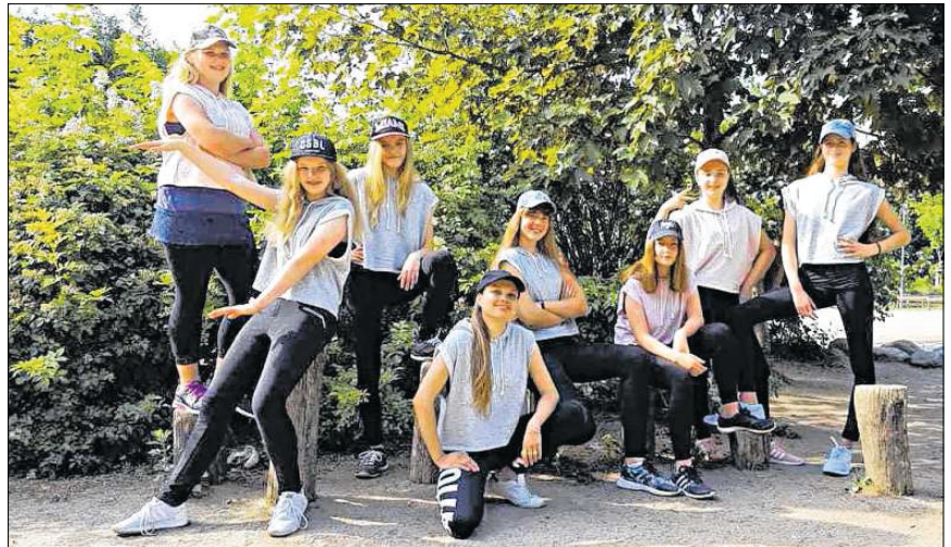
Zeigen coole Moves zu aktueller Musik: „Rhythm Attack“.